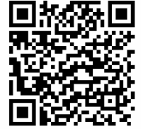
Mi Home Android