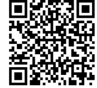
Mi Home iOS