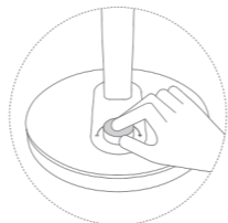
יש ללחוץ ולסובב את הבורר לכיוון טמפרטורת הצבע