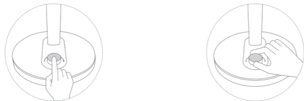
יש ללחוץ על הבורר לכיבוי/הדלקת המנורה